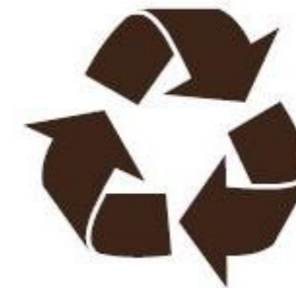
100% GRØN ENERGI

UNIQA anbefaler altid at bruge gummiunderlag som faldunderlag til legepladsen. Flere steder anvendes underlaget som den primære del af legepladsen eller selve legepladsen, da kun fantasien sætter grænser for mulighederne.