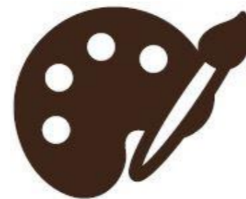
DESIGN DIN EGEN

Vil du gerne have den bedste løsning som underlag til din legeplads? Det elastiske og eftergivende faldunderlag beskytter børnene fra alvorlige skader ved fald og overholder de højeste krav inden for sikkerhed og faldhøjder i henhold til DS/EN1176 og DS/EN1177.